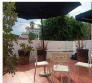
Minerva Calle Emilio Castelar #53 Col. Arcos Vallarta 3310315586