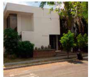
Ciudadela Calle Kabah #1592 Col. Ciudad del sol 3310315587