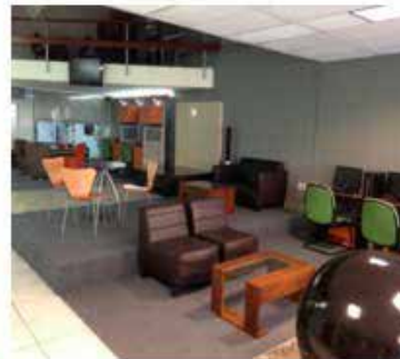
Zona Centro. Reforma #877 Col. Jesus 3330700265