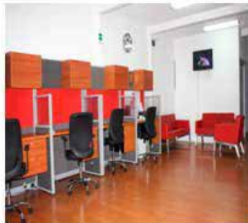
Jardines del Sol. Cubilete #2953 Col. Jardines de Plaza del Sol 3336470569